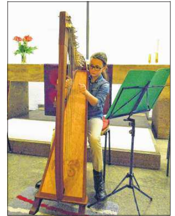
Konzert mit Harfe.

„Hört ihr wie die Engel singen“ von Mendelsohn brachte mit Gitarren und Flöten wieder strahlenden Glanz.